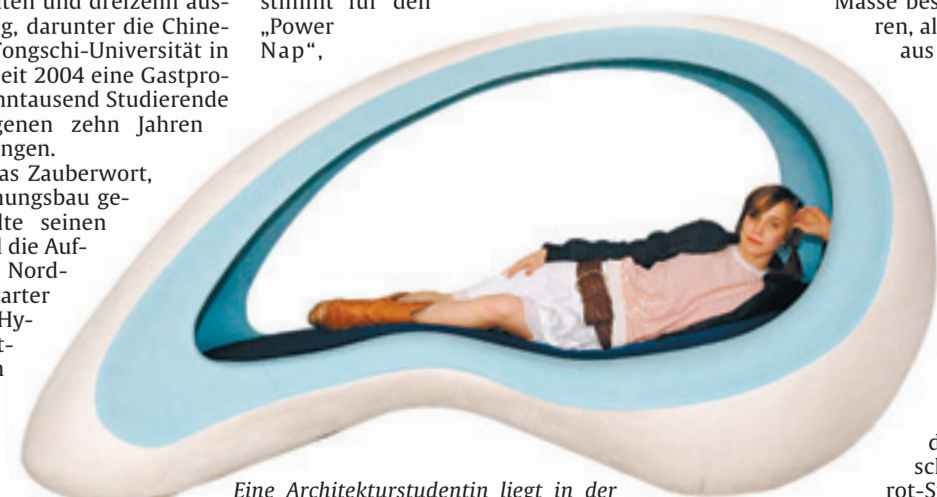
Eine Architekturstudentin liegt in der „Nap-Kapsel“ fürs Nickerchen.

stück im Scharnhäuser Park gewannen zwei Brüder einen mit 15 000 Euro dotierten Studentenwettbewerb: Ihr Wohnhaus wird derzeit gebaut. In einer Dissertation werden die Wohnbedürfnisse der „Creative Class“ untersucht, jener Minderheit im städtischen Gefüge, die dem Buch Richard Floridas zufolge die Entwicklung vorantreibt. Mit einem eleganten Wohnmöbel, bestimmt für den „Power Nap“.