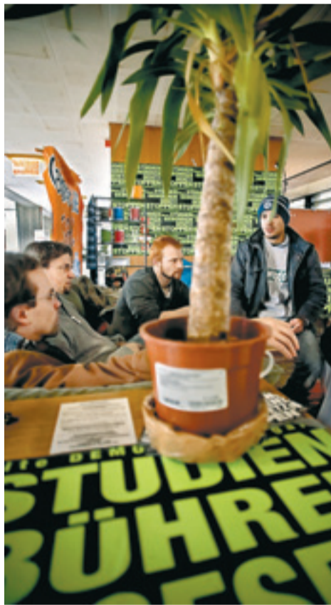
Protestwohnen gegen Studiengebühren in der Uni Stuttgart: fröhlich und harmlos?

Letztlich scheiterte der Boykott gegen die Gebühren jedoch nicht an der Angst der Eltern, 500 Euro zu verlieren. Es fehlte schlicht die Masse an Mitstreitern. 6100 Studenten hätten die Zahlung verweigern müssen, nur 1644 haben es getan. Eines steht fest: fast 40 Jahre nach 1968 muss sich das Establishment vor diesen Studenten bestimmt nicht fürchten.